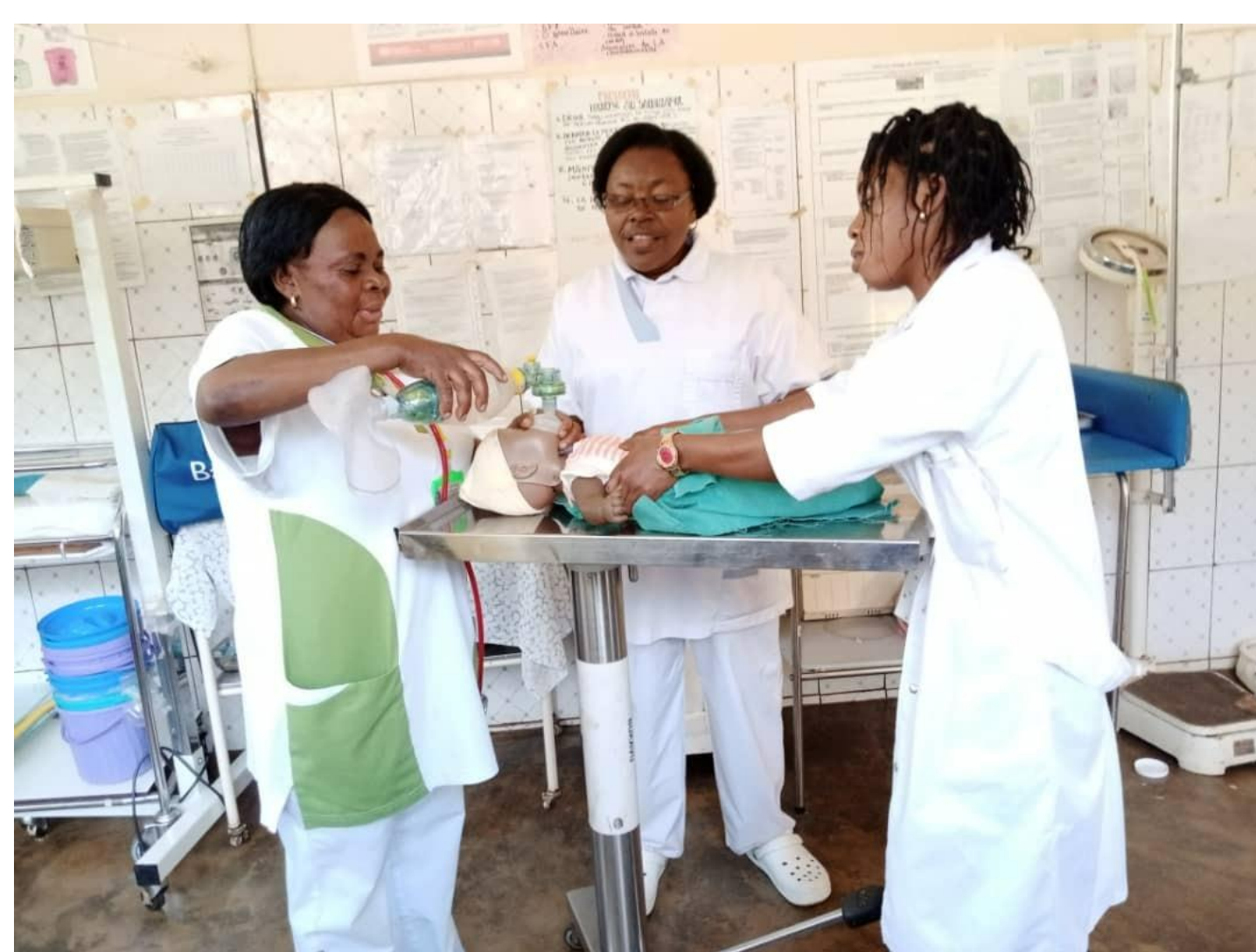
Supervision maternité de l'HGR Monvu Supervisie van de kraamzorg van ARZ in Monvu