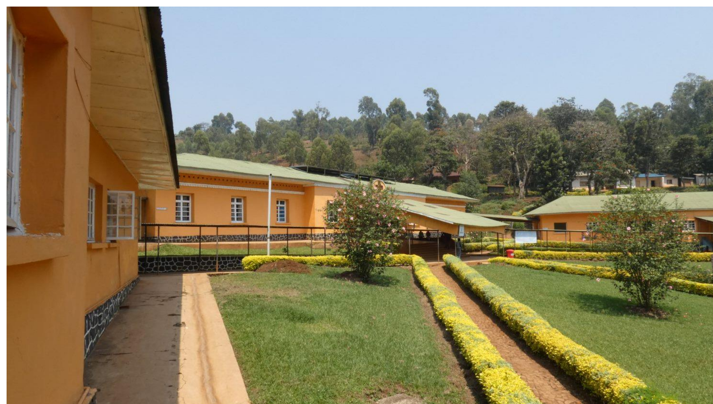
Vue de l'Hôpital Général de Référence (HGR) de Monvu Zicht op het Algemeen Referentie Ziekenhuis (ARZ) in Monvu

MSV renforce l'offre de soins dans huit hôpitaux généraux de référence partenaires dans la région de Bukavu (Sud-Kivu). Il appuie ses partenaires en équipement et matériel, y compris la maintenance des équipements biomédicaux, et renforce les capacités médicotéchniques et organisationnelles des professionnels de santé par différentes activités.