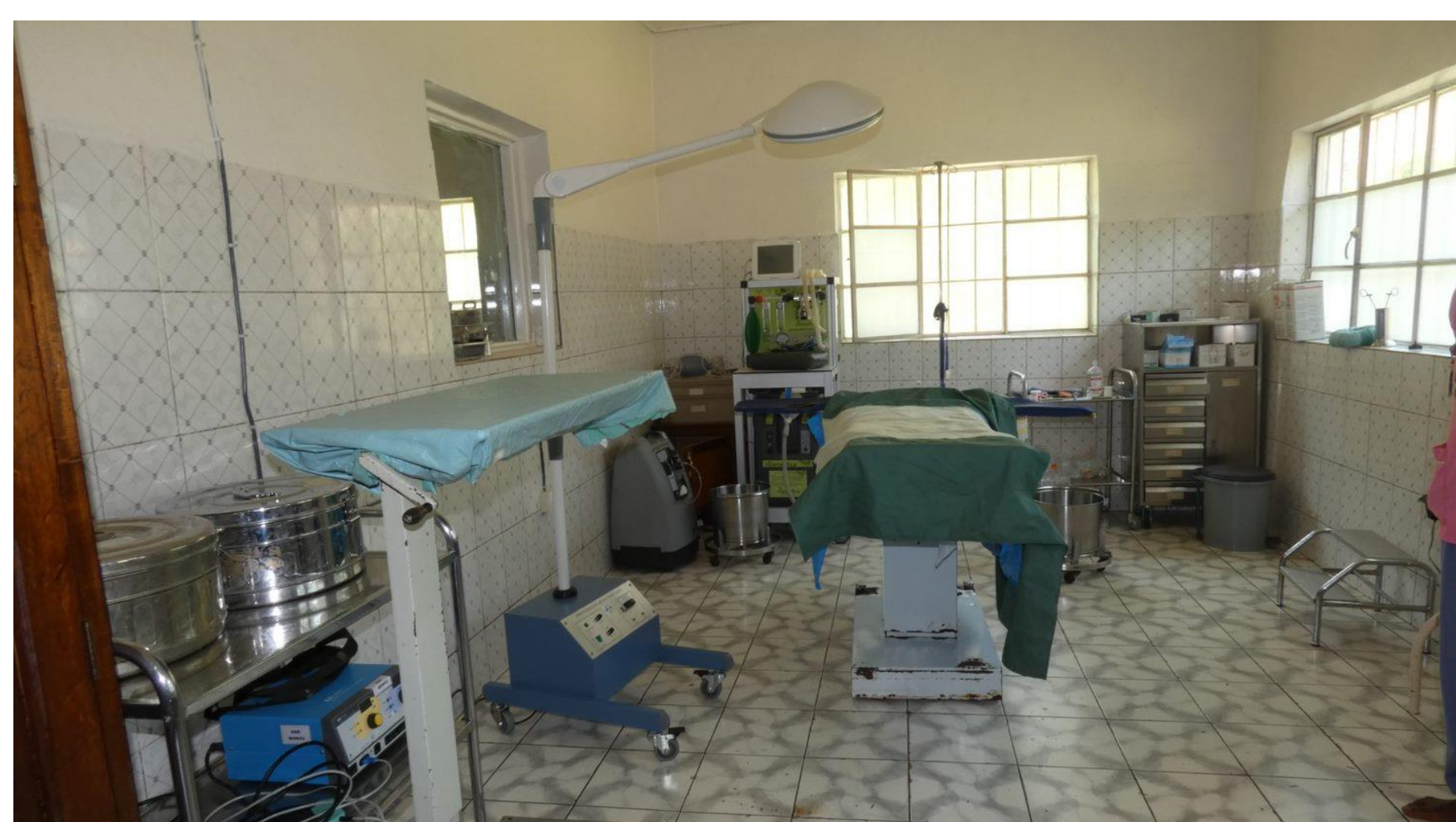
Amélioration de l'hygiène de la salle d'opération grâce à la supervision Verbeterde hygiëne in de operatiekamer door supervisie

L'implantation de telles stratégies relève à la fois de la gestion et de la recherche opérationnelle. Il s'agit ici d'un bon exemple du rôle des membres de l'ARSOM qui contribuent non seulement au développement de la science, mais là où ils le peuvent à celui de l'humanité.