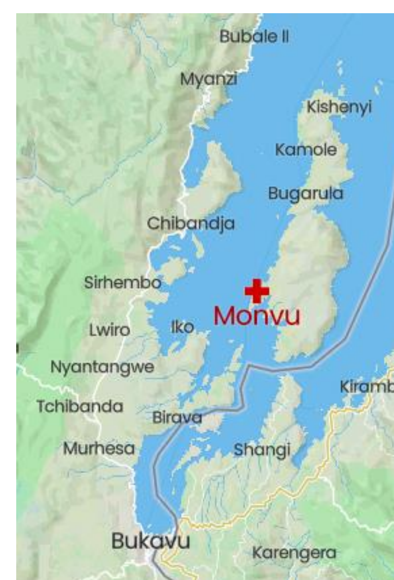
L'HGR Monvu, situé au sud-ouest de l'île d'Idjwi Het Monvu ARZ is gelegen in het zuidwesten van het eiland Idjwi

Les missions des Experts Volontaires (nationaux et internationaux) occupent une place importante dans la stratégie de renforcement de capacités MSV. À l'est du Congo, ces missions sont soutenues par des supervisions formatives effectuées par l'équipe de superviseurs du BDOM. Selon les besoins des hôpitaux partenaires, une supervision est organisée dans les domaines suivants: labo, hygiène hospitalière et soins mères-enfants. Cette approche est bien appréciée par les partenaires congolais. Néanmoins, un renforcement de l'équipe de superviseurs dans la méthodologie était souhaité. Dans le cadre de la collaboration de MSV avec les autorités sanitaires locales, les cadres du Bureau d'Appui Technique de la Division Provinciale de la Santé ont participé également à cet atelier de formation.