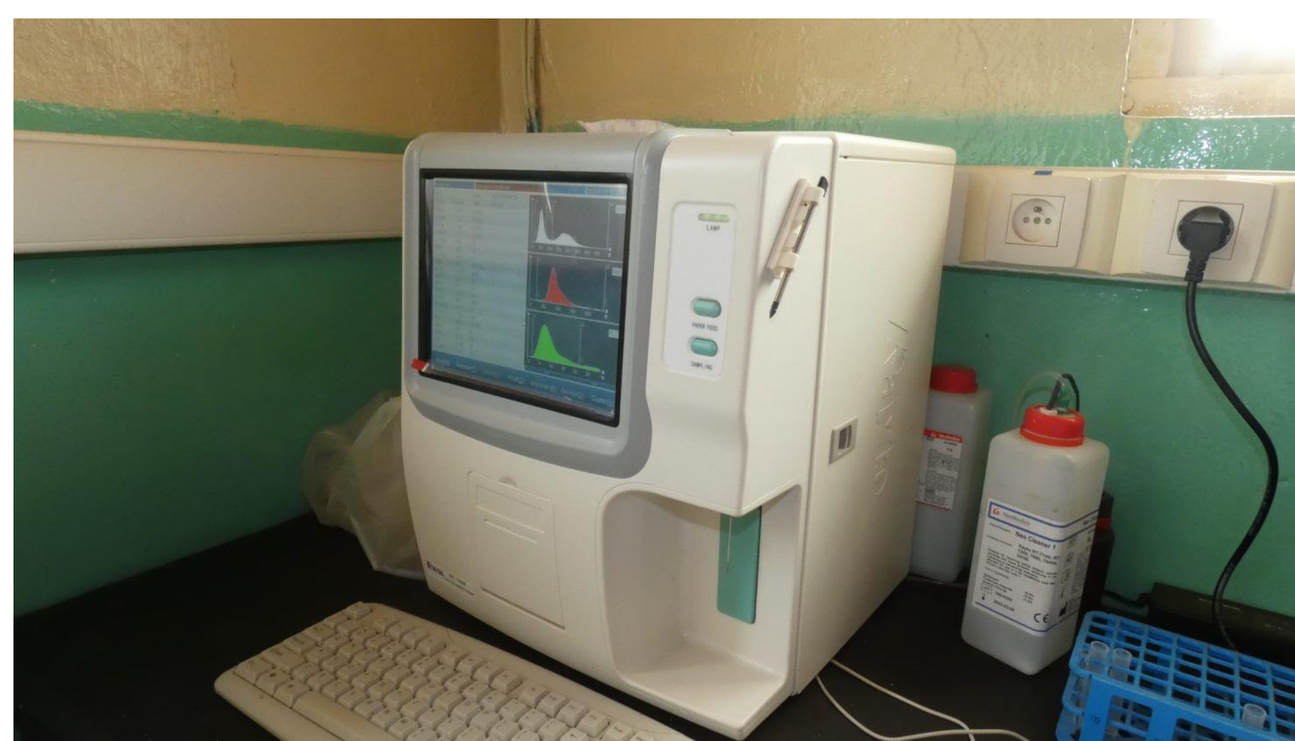
Équipement fonctionnel du laboratoire de l'HGR Monvu grâce à la supervision Functionele uitrusting van het Monvu ARZ laboratorium door supervisie