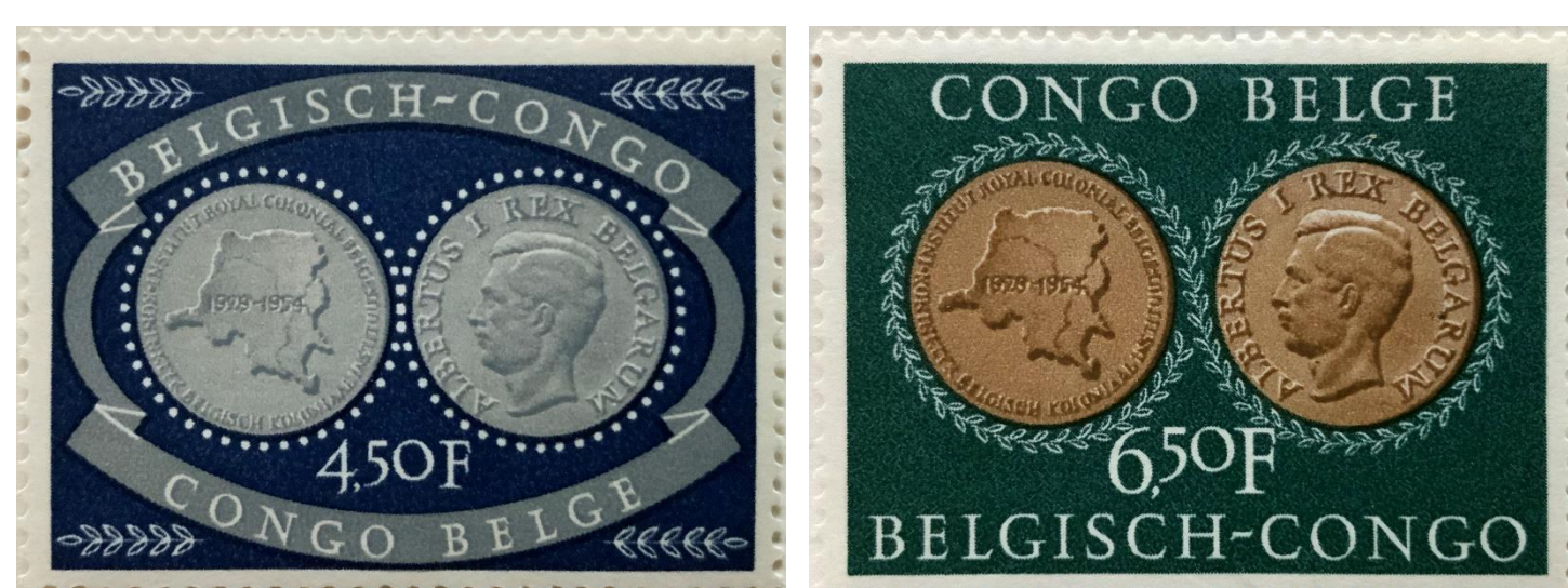
27.12.1954 postzegeluitgifte ter gelegenheid van de 25ste verjaardag van het Koninklijk Belgisch Koloniaal Instituut. 27.12.1954 émission postale à l'occasion du 25 ème anniversaire de l'Institut Royal Colonial Belge.