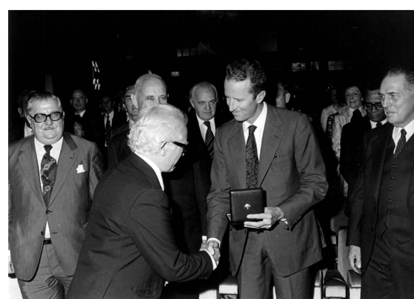
Bezoek van Z.M. de Koning ter gelegenheid van de 50ste verjaardag van de Academie. Visite de S.M. le Roi à l'occasion du 50 ème anniversaire de l'Académie.