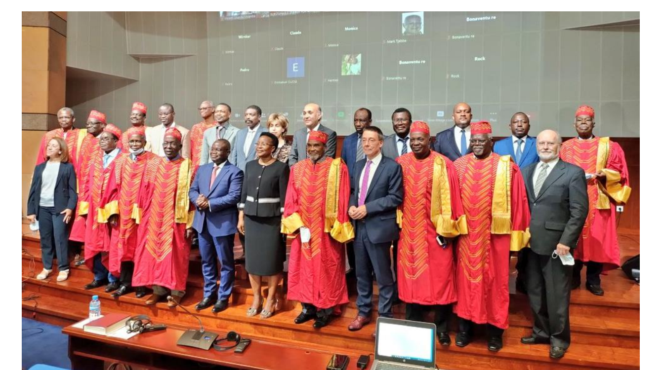
Sustainable Energy for Africa II , December 2021 Internationale conferentie mede georganiseerd door KAOW en ANSALB. Conférence internationale co-organisée par l'ARSOM et l'ANSALB.