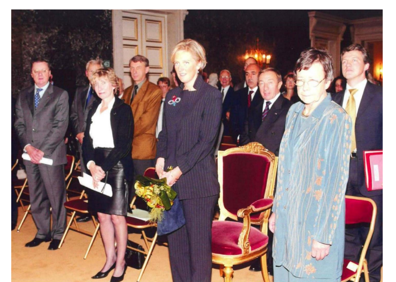
Bezoek van H.K.H. Prinses Astrid ter gelegenheid van de 75ste verjaardag van de Academie. Visite de S.A.R. la Princesse Astrid à l'occasion du 75 ème anniversaire de l'Académie.