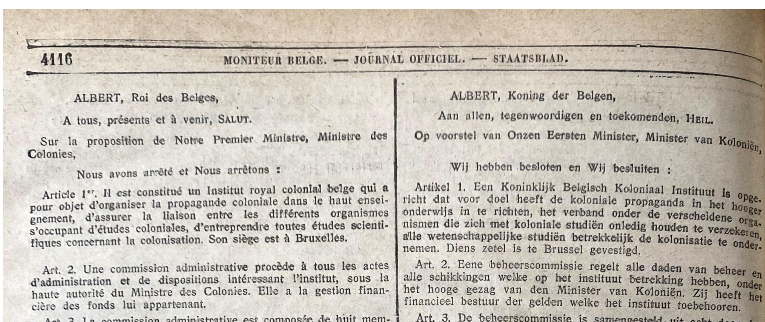
K.B. van 04.09.1928 houdende de oprichting van het Koninklijk Belgisch Koloniaal Instituut . A.R. du 04.09.1928 portant création de l' Institut Royal Colonial Belge .