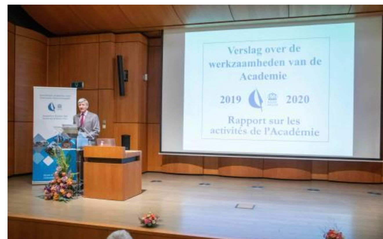
Openingszitting van het academiejaar 2020-2021. Séance d'ouverture de l'année académique 2020-2021.